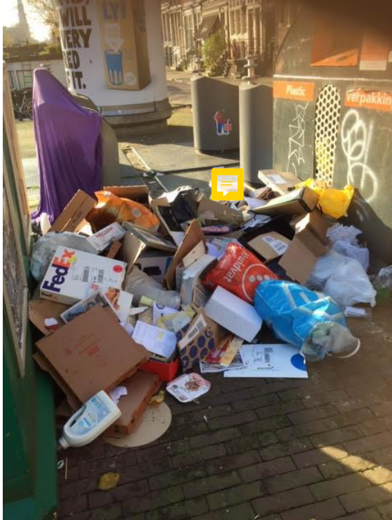
Foto 1 t/m 3 Eenhoornsluis. Foto 4 Nieuwmarkt. Foto 5 Oudeschans. Foto 6 Elandsgracht. Bijscript bij alle foto's: Hoezo historisch erfgoed?