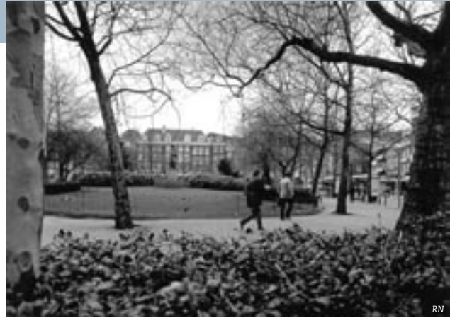
Van één kant ziet het Rembrandtplein er nog gaaf uit.

Nu kende ik het Rembrandtplein en het Thorbeckeplein al wat langer. Ruim 50 jaar geleden nam mijn vader mij regelmatig mee naar de Rembrandtbar hoek Halvemaansteeg, onze favoriete stek, buiten op een klein ongebouwd terras, waar oude mannen, dat vond ik toen, in de Figaro de uitslagen van de paardenkoersen volgden. Een roze krant met een voor mij onbegrijpelijke