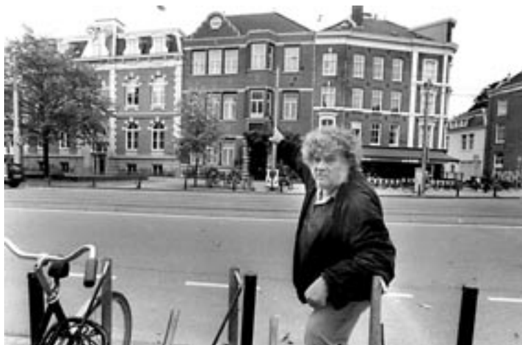
Ron voor de Wilhelmina Catherinaschool