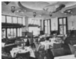
Restaurant aan de straatkant