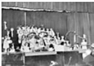
10 jarige Wilhelmina Catherinaschool

Tegenover hotel Atlantic heeft in een kelder, zo ontdekt Ronny, een joodse jongen uit Den Haag zich verscholen. Willy is zijn naam. Ronny sluit